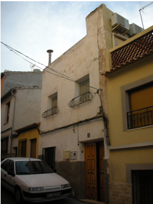
CALLE IGLESIAS Nº 30

INTERES: NULO GRADO DE PROTECCION: NINGUNO