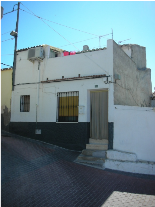
CALLE HUMILLADERO Nº 28

INTERES: NULO GRADO DE PROTECCION: NINGUNO