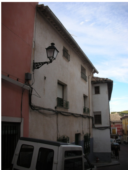
CALLE IGLESIAS Nº 16

INTERES: NULO GRADO DE PROTECCION: NINGUNO