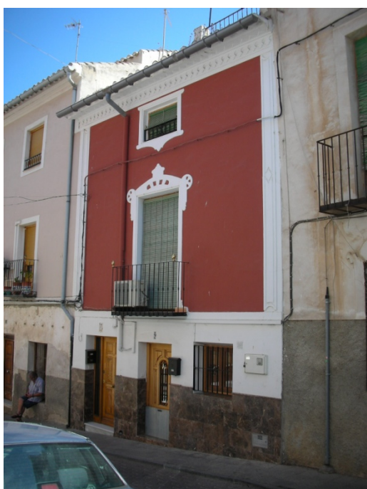
CUESTA DE LAS HERRERÍAS Nº 7