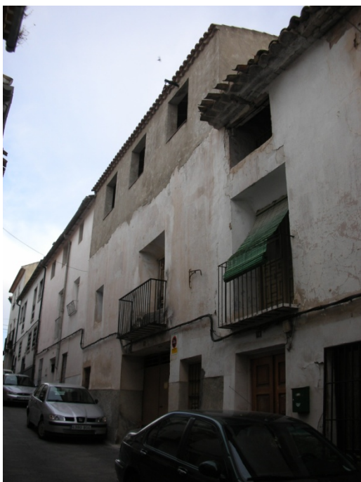
CALLE DEL HOYO Nº 16