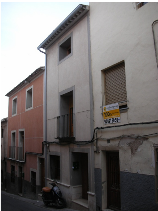
CALLE DEL HOYO Nº 38

OBSERVACIONES: ESQUINA A C/ PROMERA TRAVIESA