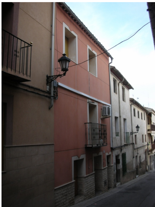
CALLE DEL HOYO N° 47

OBSERVACIONES: EL EDIFICIO LO CONFORMAN LOS N°S 44 Y 46