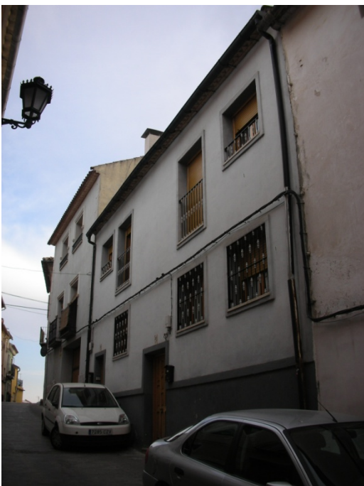
CALLE DEL HOYO Nº 20

INTERES: NULO GRADO DE PROTECCION: NINGUNO