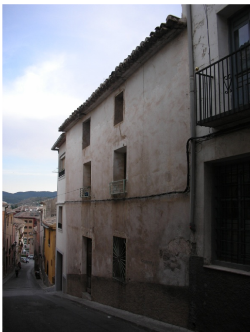
CALLE DEL HOYO Nº 32

OBSERVACIONES: VIVIENDA REHABILITADA TIENE GARAJE