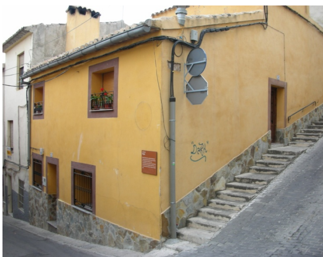
CALLE DEL HOYO Nº 34