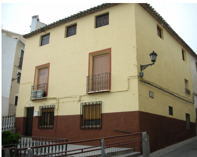
CALLE DEL HOYO Nº 52

OBSERVACIONES: TIENE GARAJE ESTADO DE SEMIABANDONO