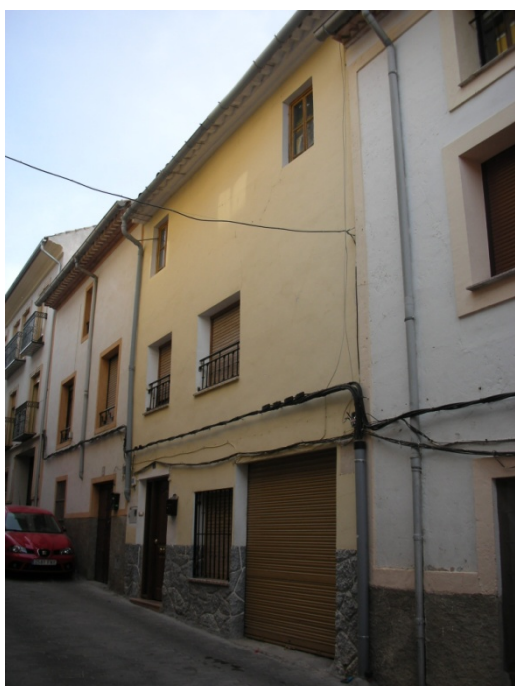
CALLE DEL HOYO Nº 6

INTERES: NULO GRADO DE PROTECCION: NINGUNO