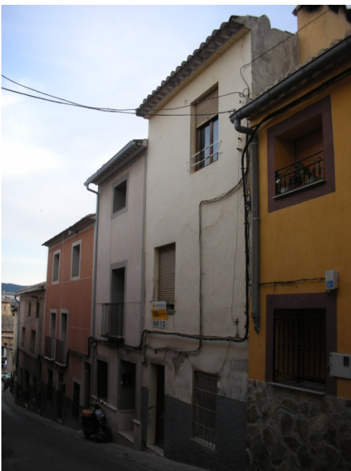
CALLE DEL HOYO Nº 36

INTERES: NULO GRADO DE PROTECCION: NINGUNO