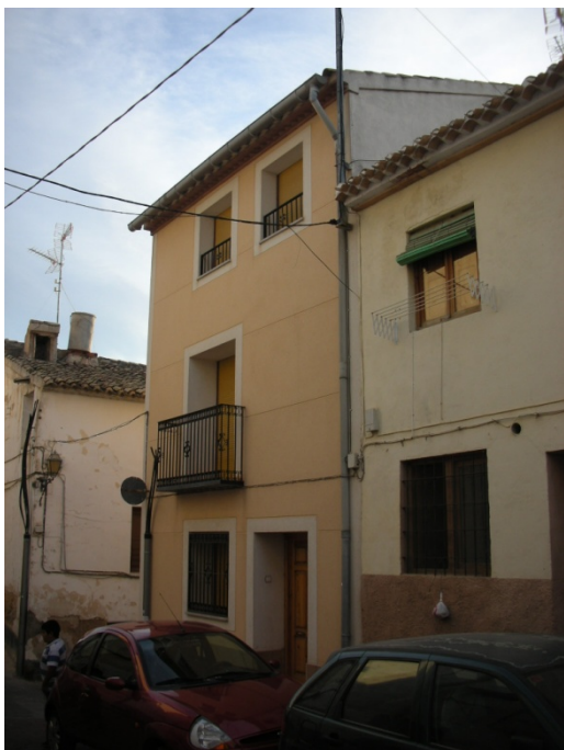
CALLE IGLESIAS Nº 56