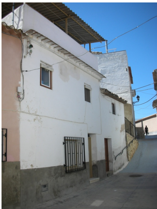
CALLE HUMILLADERO Nº 13 A

INTERES: NULO GRADO DE PROTECCION: NINGUNO