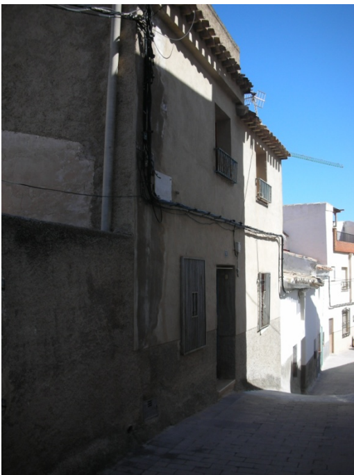
CALLE HUMILLADERO N° 14

INTERES: NULO GRADO DE PROTECCION: NINGUNO