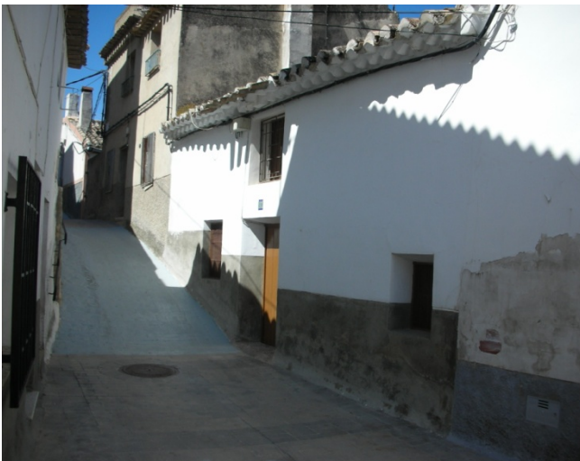
CALLE HUMILLADERO Nº 12