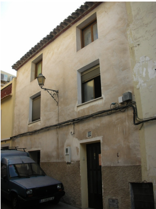
CALLE IGLESIAS Nº 26

INTERES: NULO GRADO DE PROTECCION: NINGUNO