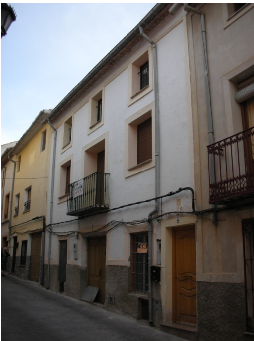
CALLE DEL HOYO Nº 4

OBSERVACIONES: MISMO EDIFICIO QUE EL Nº1 VIVIENDA REHABILITADA