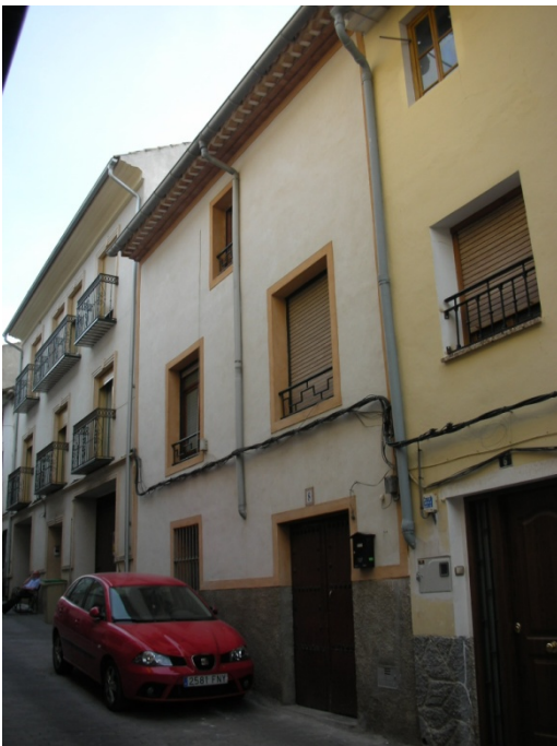
CALLE DEL HOYO Nº 8

INTERES: NULO GRADO DE PROTECCION: NINGUNO