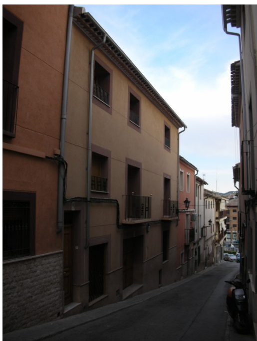
CALLE DEL HOYO Nº 43-45