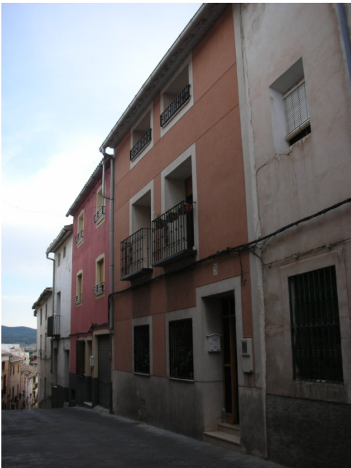
CALLE DEL HOYO Nº 26