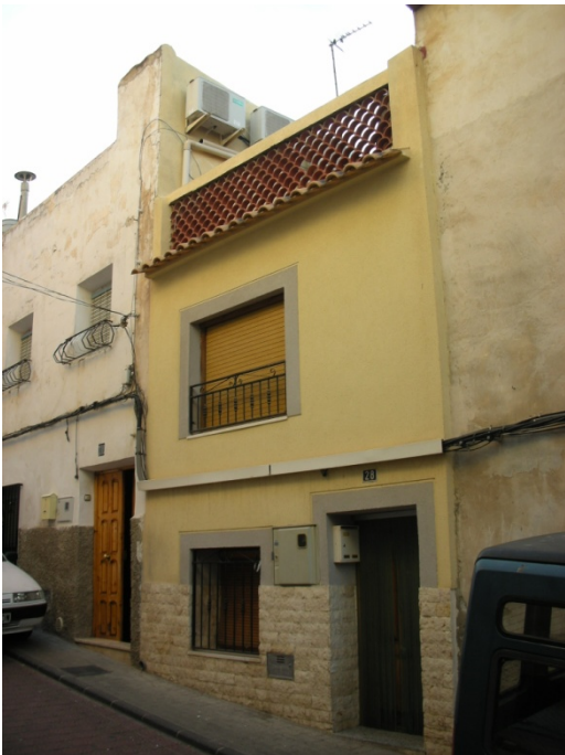
CALLE IGLESIAS N° 28

INTERES: NULO GRADO DE PROTECCION: NINGUNO