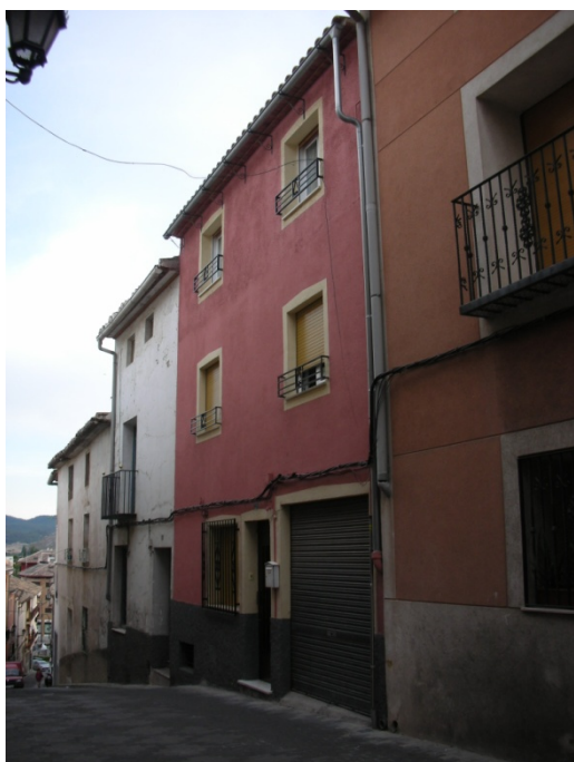
CALLE DEL HOYO Nº 28