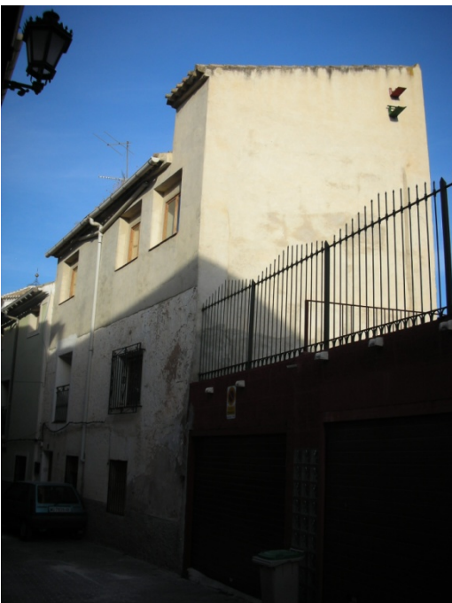
CALLE DOMINGO MORENO Nº 7

INTERES: NULO GRADO DE PROTECCION: NINGUNO