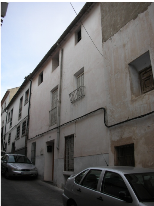
CALLE DEL HOYO Nº 18