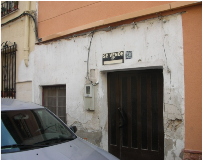
CALLE IGLESIAS Nº 36

INTERES: NULO GRADO DE PROTECCION: NINGUNO