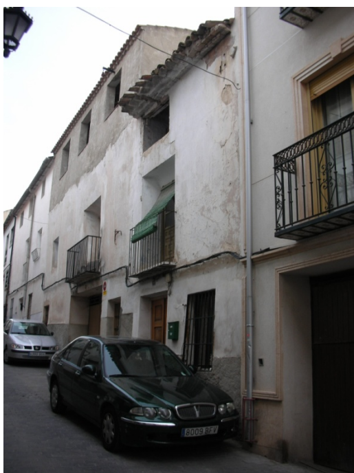
CALLE DEL HOYO Nº 14

INTERES: NULO GRADO DE PROTECCION: NINGUNO