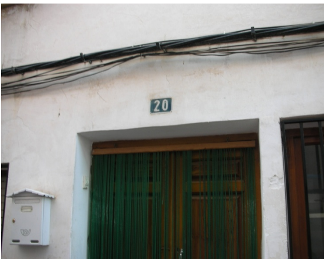
CALLE IGLESIAS Nº 20