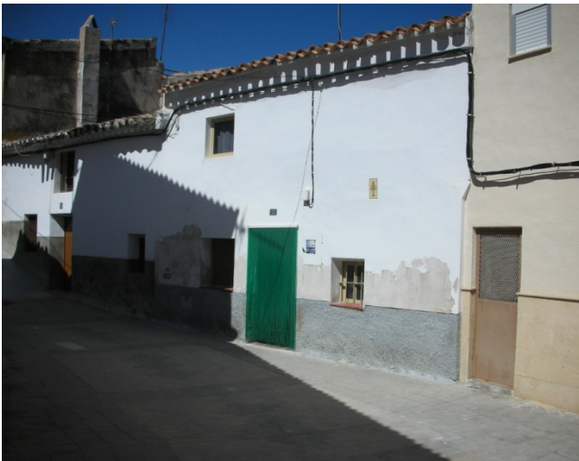
CALLE HUMILLADERO Nº 10

INTERES: NULO GRADO DE PROTECCION: NINGUNO