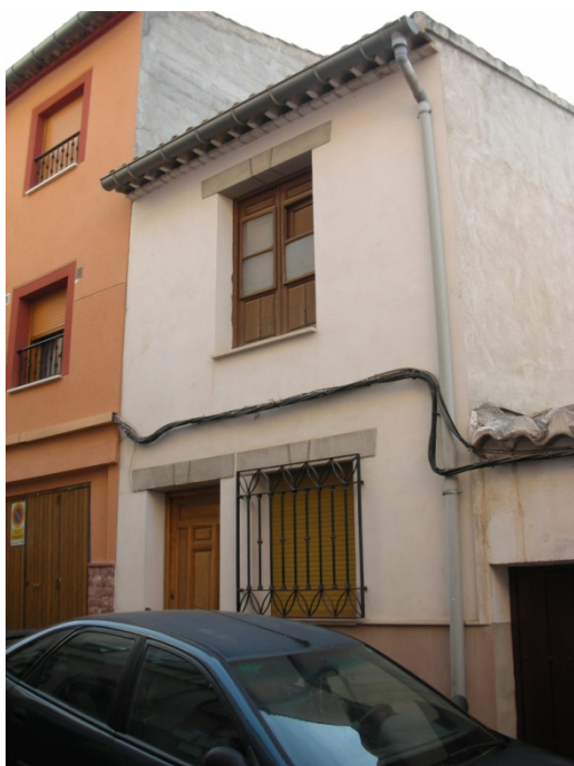
CALLE IGLESIAS Nº 32

INTERES: NULO GRADO DE PROTECCION: NINGUNO