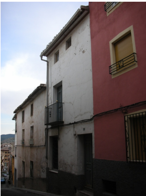
CALLE DEL HOYO Nº 30

OBSERVACIONES: ESQUINA A C/ SEGUNDA TRAVIESA