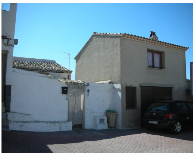
CALLE HUMILLADERO Nº 26

INTERES: NULO GRADO DE PROTECCION: NINGUNO